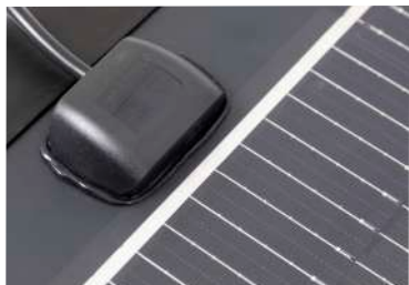
La boîte de jonction des PERC HD Slim est extra-plate.

Les panneaux solaires semi-rigides de la gamme PERC HD slim sont composés de cellules PERC , d'un revêtement HPC polymère et d'un cadre extra-fin en aluminium .